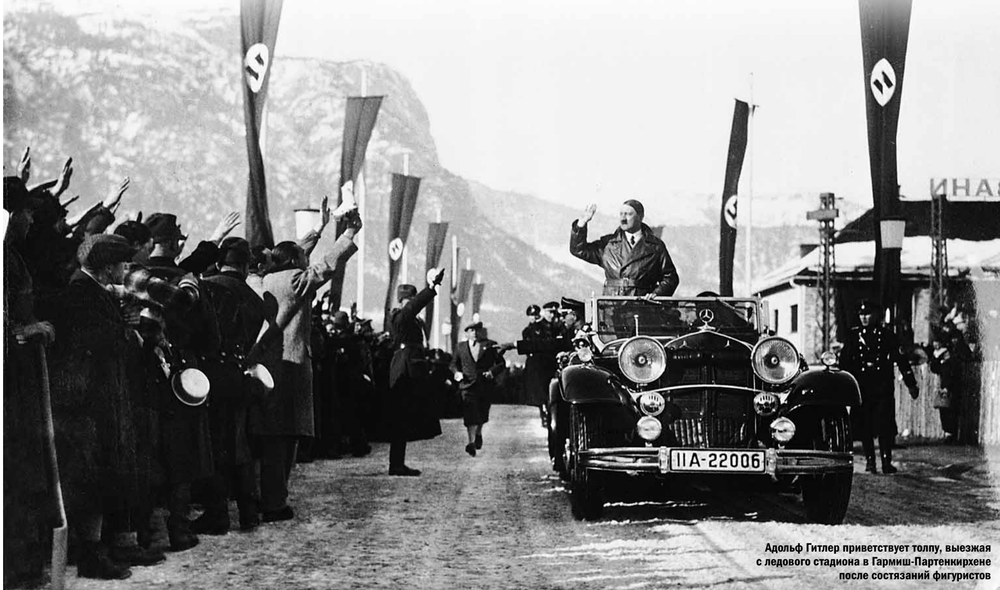
Адольф Гитлер приветствует толпу, выезжая с ледового стадиона в Гармиш-Партенкирхене после состязаний фигуристов

В 1945 году президентом МОК стал Эйвери Брандэдж. На этом посту он неустанно боролся с профессионализмом в спорте, беспощадно изгоняя из олимпийских рядов и лишая наград атлетов, замеченных в участии в профессиональных соревнованиях. При этом он делал вид, что принимает за чистую монету любительский статус спортсменов советского блока, которые часто лишь числились рабочими или военными. В 1972 году именно он принял решение продолжать Игры в Мюнхене после убийства палестинскими террористами 11 израильских атлетов. Брандэдж умер в 1975 году в Гармиш-Партенкирхене и похоронен в Чикаго. Однажды на траве рядом с его надгробьем появилась сделанная цветным спреем надпись на иврите: «Народ Израиля живет».